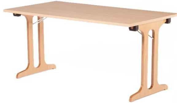
COM.FORT de Lux Tisch