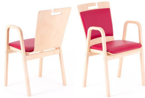
HOR.IZONT de Lux AL